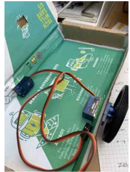
4 | Schülerinnen und Schüler sowie Erwachsene übten sich im Programmieren und im Bauen von Robotern.

Ausserdem hat das Institut für Informatik der UZH zusammen mit dem Departement Informatik der ETH erfolgreich eine Informationsveranstaltung zum Informatikstudium durchgeführt. Das Format ist ein Zeichen für die gute Zusammenarbeit der beiden Hochschulen.