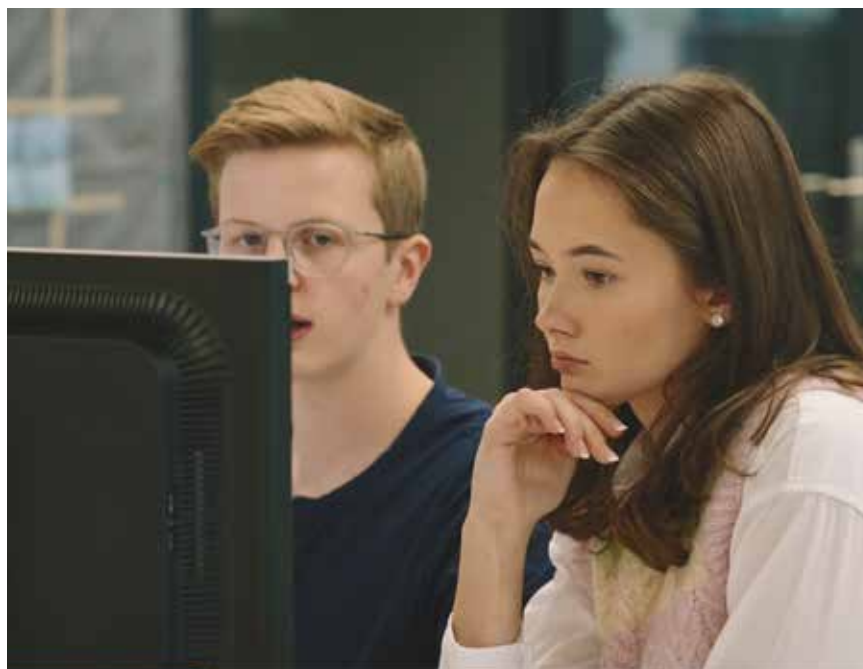
1 | Die Zürcher Kantonalbank lud zu einer Reise durch die Welt der Informatik ein.