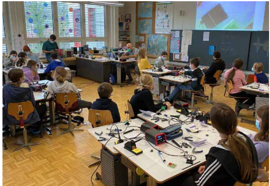
2 | Eine Einführung ins Löten: Die Expertinnen und Experten von Conrad zeigen den Kindern und Jugendlichen, worauf es ankommt.

Die Conrad Electronic AG steuerte gleich zwei attraktive Elemente zum Programm bei. Zum einen den Lötkurs, bei dem drei Conrad-Mitarbeitende an neun verschiedenen Schulen vor Ort waren und Grundkenntnisse zum Thema Weichlöten, den Werkzeugen und dem sicheren Umgang mit dem Material vermittelt haben. 175 Schülerinnen und Schüler haben unter ihrer Anleitung selber einen Bausatz erstellt und konnten diesen auch gleich mit nach Hause nehmen. Ein spannender und lehrreicher Kurs, der grossen Anklang fand. Zum anderen fanden an drei Nachmittagen virtuelle Informationsveranstaltungen zum Thema LEGO Education statt. An diesen nahmen 37 Lehrpersonen teil, um sich mit dem LEGO-Education-Lehrkonzept vertraut zu machen. Sie erfuhren, wie sie das Hilfsmittel optimal im Unterricht einsetzen können und wie es sie dabei unterstützt, MINT-Themen spielerisch zu vermitteln.